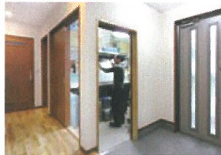
「玄関ホールには家族用靴脱ぎ場を兼ねたクロゼットを用意しました。これはおススメです」