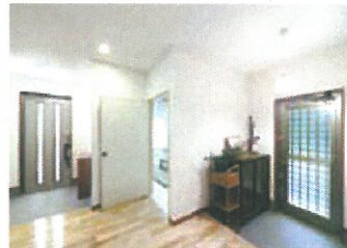
2世帯住宅には適度な距離感が必要。K邸では広いホールを中心に2つの玄関を用意