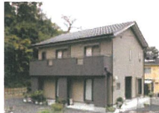
「心地よく快適に暮らせる2世帯住宅をと、念入りの対応で、最高の住まいができました」