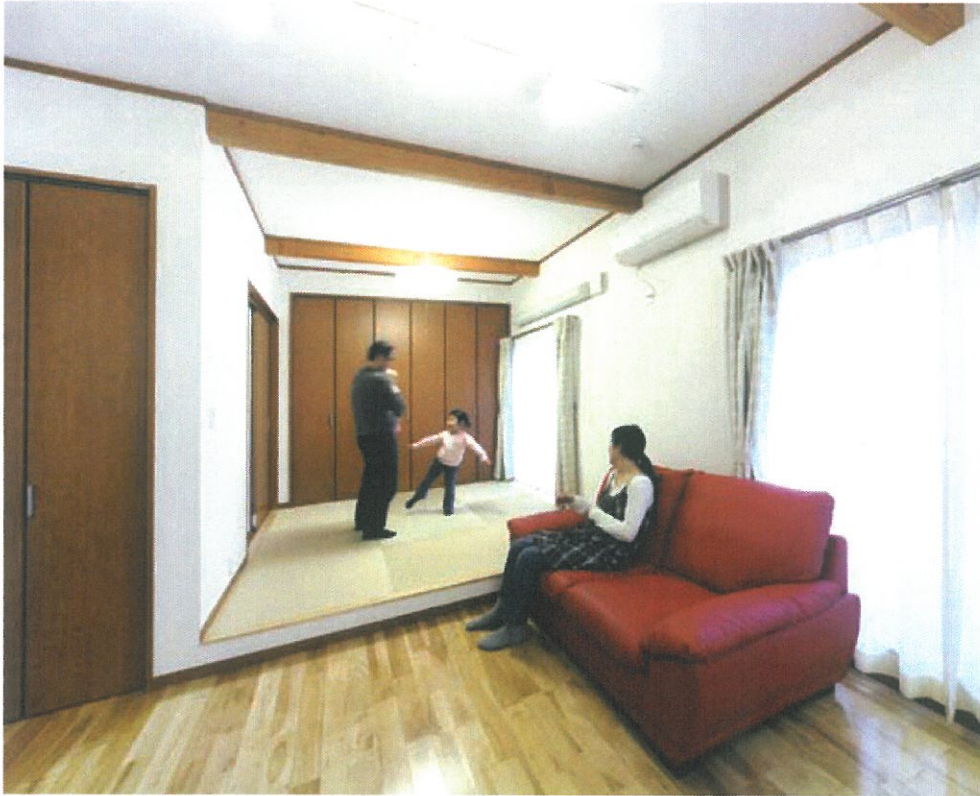
「日頃使える和室をと畳コーナーを採用しましたが、床の埃が入りにくく、腰掛けることもできる床上げにしました。子どもの遊び場はもちろん、僕らがくつろぐのにも大活躍しています。床はサクラの無垢床です。僕らも子どもたちも感觸のよさを堪能しています」