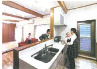
「2階の天井を梁見せにして無垢材ならではの味わいと開放感を両立してもらいました」