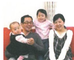
「社長の対応は車のアフター対応以上の確かなレスポンスです！」